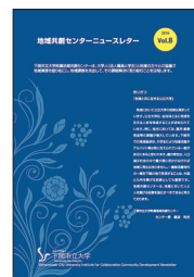
地域共創センターニュースレター Vol.8