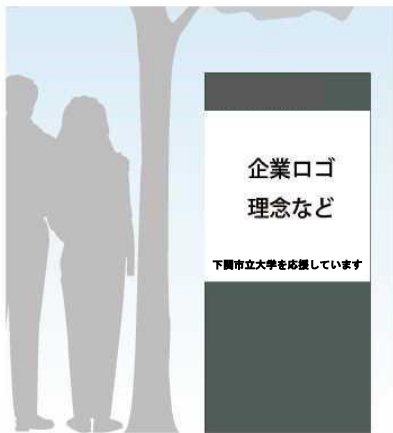
(例) 土地の場合 ※サイズは希望に応じて